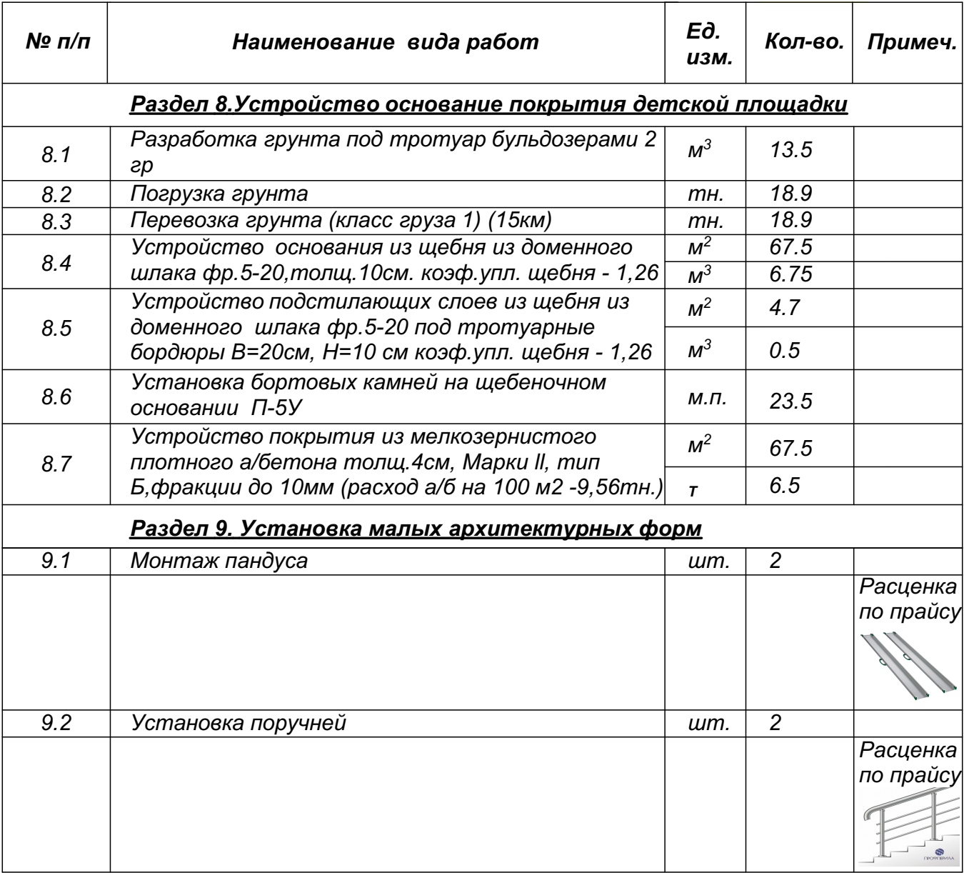
Ведомость объемов работ по благоустройству придомовой территории жилого многоквартирного дома расположенного по адресу: ул. Покрышкина 12 (минимальный перечень) (Продолжение)